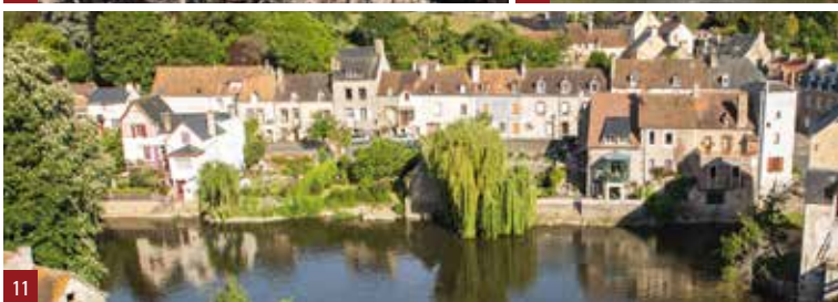
9b. Le pré de la Couture, à droite, au début du XX e siècle / 10. Moulin d'Espaillard / 11. Maisons de tisserands

date des XVIII e et XIX e siècles. Elles sont étroitement reliées au rocher et font face à la rivière (9a). De l'autre côté, s'étend l'immense pré de la Couture ayant appartenu à l'abbaye mancelle du même nom (9b). Au XIX e siècle, une blanchisserie sur pré s'y installe dont il reste un bâtiment en ruine.