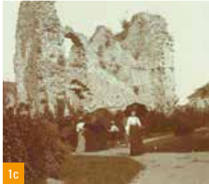
1a. Châtelet / 1b. Vestiges du grenier à sel / 1c. Parc du château, photographe Jules Gencey, 1906