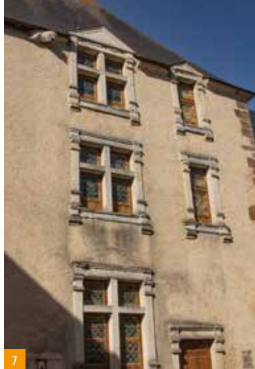
6b. Ruelle du Cygne / 6c. Fronton triangulaire au n° 12 de la Grande Rue / 7. Façade de l'hôtel de Chervy