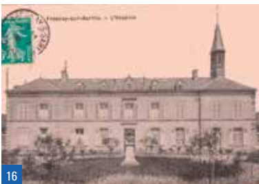
15a. Portique des halles / 15b. Détail, le mot « mouture » peint sur l'un des piliers des halles / 16. Le nouvel hospice vers 1910 dans le quartier Saint-Sauveur